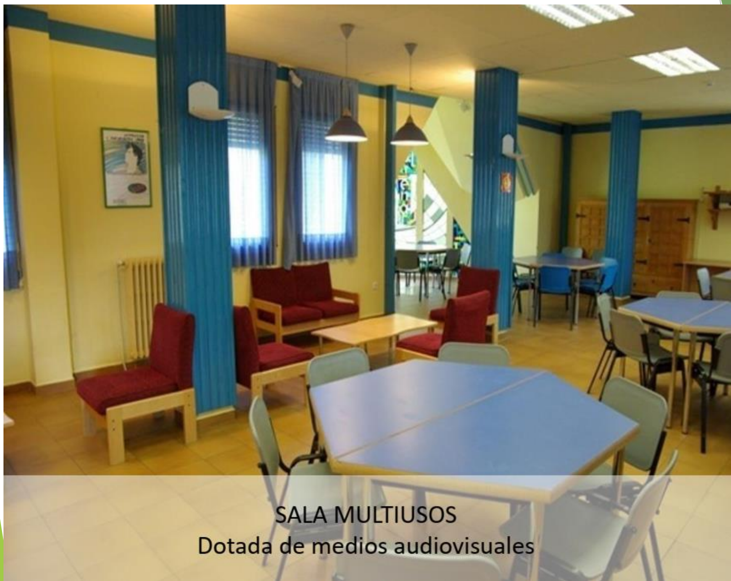
SALA MULTIUSOS Dotada de medios audiovisuales